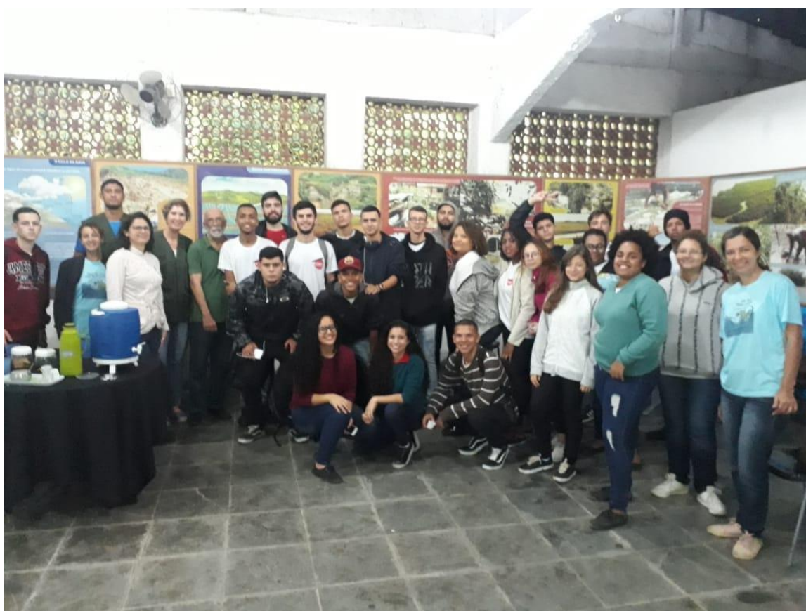
Praça da Cantareira – Campanha de recebimento de resíduo eletrônico