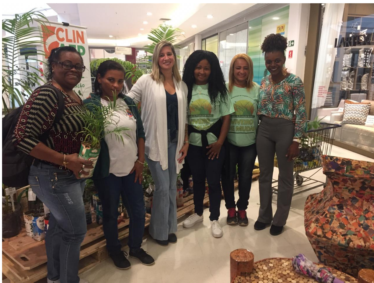
Exposições no Shopping Icaraí