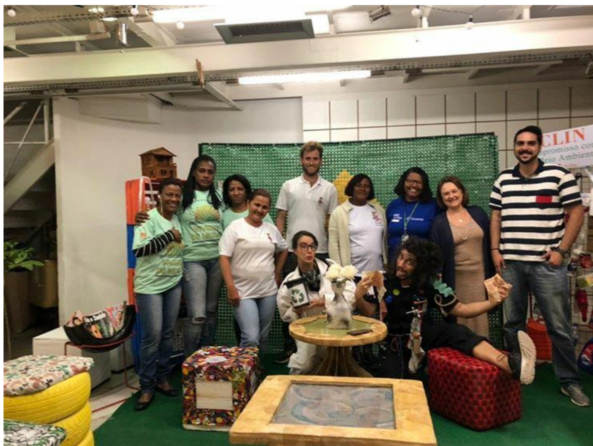
Exposições no Shopping Itaipu Multicenter