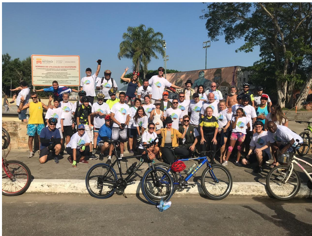
Plantio e limpeza da Ilha do Pontal