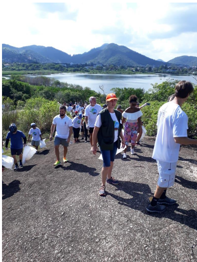
Exposições no Plaza Shopping